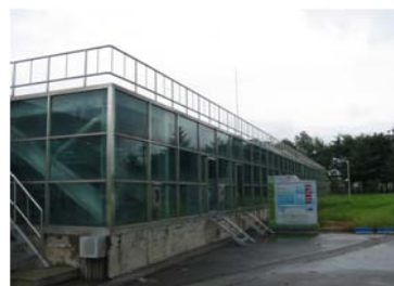
<개선 전 : 유량조정조 노출>